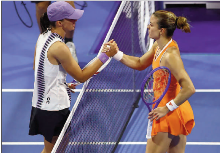
La Chinoise, encore N.4 mondiale en juin dernier, qui ne disputait à Doha que son deuxième tournoi depuis Wimbledon après une opération au coude, a perdu ce deuxième set 6-2.

Trop passive, léthargique même parfois, commettant des fautes directes inhabituelles, la Kazakhstanaise a perdu le premier set 6-4. Encore bousculée sur son premier jeu de service au deuxième set, Rybakina est alors sortie de sa torpeur. S'impliquant davantage, frappant plus fort, bataillant plus, elle a pris l'ascendant sur Zheng.