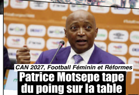
CAN 2027, Football Féminin et Réformes

Patrice Motsepe tape du poing sur la table